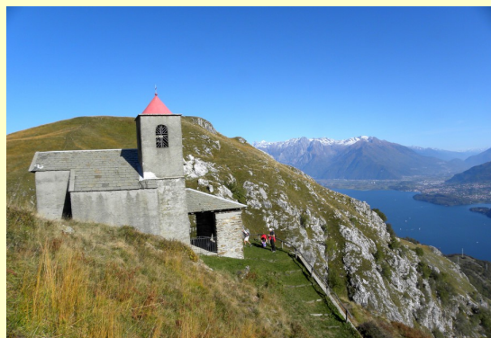
San Bernardo di Musso